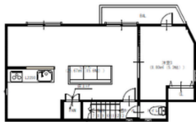
2階 平面図 S:1/100